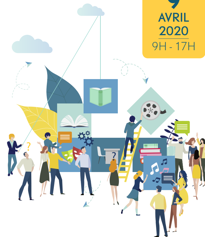
Table ronde - Ateliers - Conférence